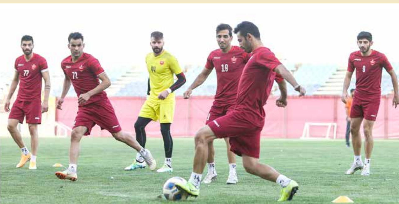
گزارش محمد قراکزلو

سه هفته دیگر پرسپولیس باید در ریاض مقابل الهلال بازی کند اما بیشتر از اینکه حواس کادر فنی و بازیکنان این تیم به نیم حرف و مسائل فنی تیم خودشان باشد به موضوع بی‌پولی منقطع‌است و درختکن تیم بیشتر از هر چیز دربارہ بدقولی‌های باشگاه در پرداخت مطالبات صحبت می‌شود. مربیان و بازیکنان پرسپولیس می‌گویند ما کارمان را انجام می‌دهیم اما اینطوری نمی‌شود که همه چیز یکطرفه باشد. آنها می‌گویند جعفر سمیعی باینکه همین مشکلات را داشت اما هل قول دادن نپود ولی وقتی صدی می‌آید و تاریخ دقیقی را برای پرداخت مطالبات اعلام می‌کند و سر قولش نمی‌ماند اینطوری تیم به هم می‌ریزد. در این شرایط کار کادر فنی سخت‌تر هم می‌شود چرا که باید بیشتر انرژی خودشان را برای صحبت کردن با بازیکنان بگذارند و مجبورند مدام با آنها حرف بزنند و امیدواری بدهند که به زودی همه چیز درست می‌شود.