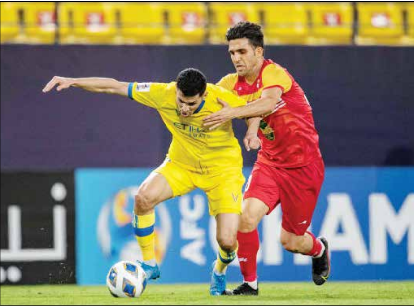
گزارش حامد حسینی

حساسیت بازی و سه امتیاز حیاتی آن باعث شده بود دو تیم خیلی ریسکی بازی نکنند. به همین دلیل آنهایی که نتوانستند نیمه اول را تماشا کنند چیزی را از دست ندادند. فولاد در دقیقه ۴۵ صاحب دو فرصت شد که اولین آن، حضور محمد میری درون هفدهم قدم النصر بود. این اتفاق در دقیقه ۳۰ رخ داد، جایی که ضربه کاشته آیندای باتوسی در مقابل دروازه‌بان النصر به میری رسید و ضربه آرام او را ولید عبدالله مهار کرد. حدود ۱۰ دقیقه بعد حرکت خوب تجاریان را که به لحاظ راست و جا گذاشتن دو بازیکن النصر، منجر به خلق یک موقعیت شد که توپ ارسالی این بازیکن به شکل خطرناکی دفع شد. هرچه بود دو تیم بدون گل به رختکن رفتند در حالی که هم‌زمان با این بازی السد با گل دقیقه ۱۳ سانتی کازورلا ز روی نقطه پنالتی دروازه الوحدات اردن را باز کرده بود. السد با همین یک گل به رختکن رفت که بهترین اتفاق بازی شاگردان زاوی بود.