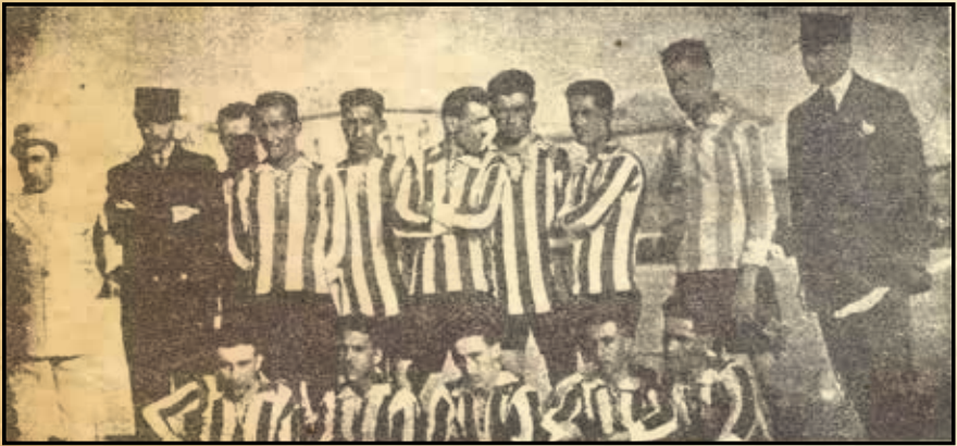
تیم منتخب طهران در دومین دیدار برابر منتخب آذربایجان