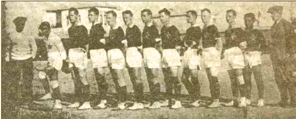
تیم یادکوبه در روز هشت آذرماه

به همین خاطر منتقدی تر آن است که تمام این وقایع بعد از بازی‌های سال ۱۳۰۸ اتفاق افتاده باشد. زیرا از